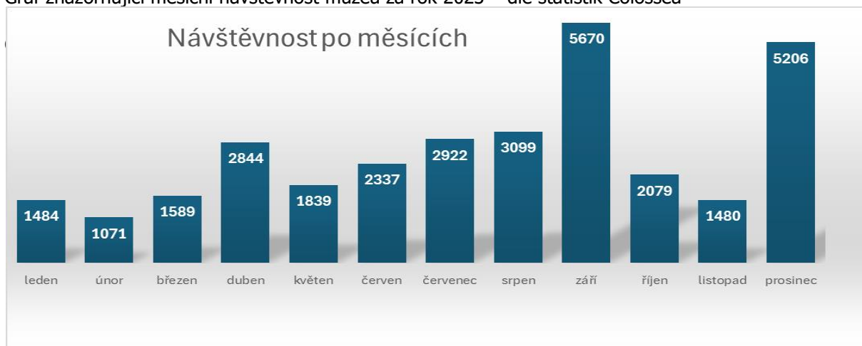
Graf znázorňující měsíční návštěvnost muzea za rok 2023 – dle statistik Colossea