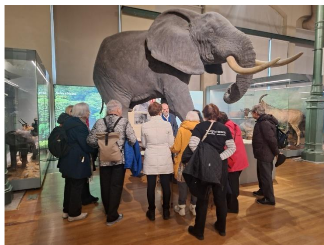
Prohlídka stálých přírodovědných expozic muzea.