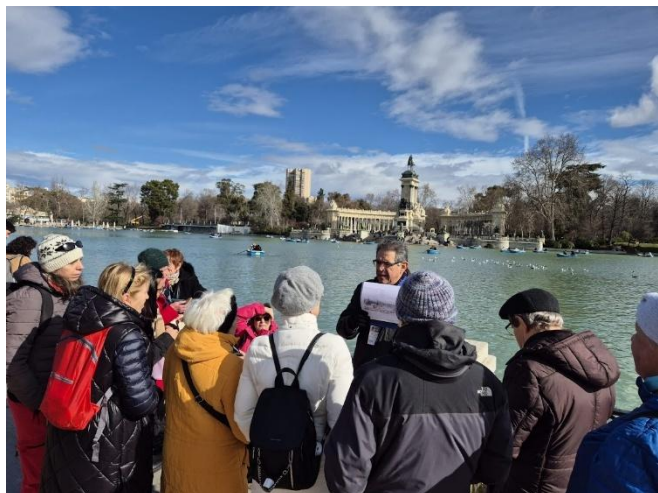
Komentovaná prohlídka parku Retiro s dobrovolníkem z řad CEATE.