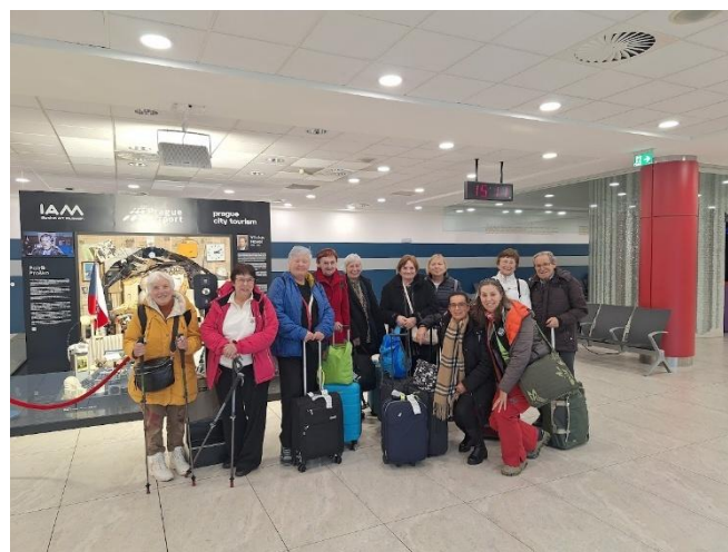
Závěrečná fotografie aneb šťastný návrat domů.