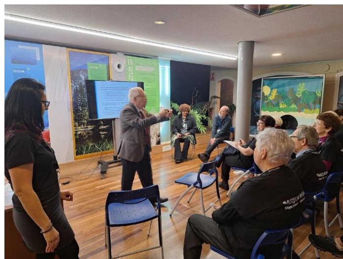
První den v instituci, přivítání se zástupci muzea a dobrovolníků z řad CEATE.