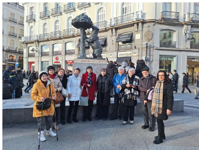
Komentovaná prohlídka historického centra města Madrid.