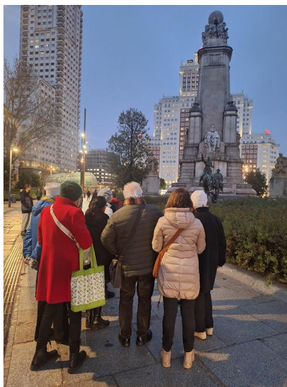
Večerní komentovaná prohlídka města.