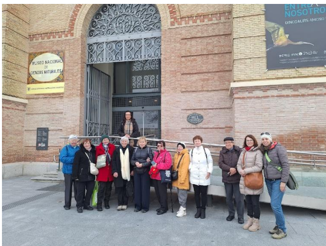
Skupinová fotografie před Museo Nacional de Ciencias Naturales.