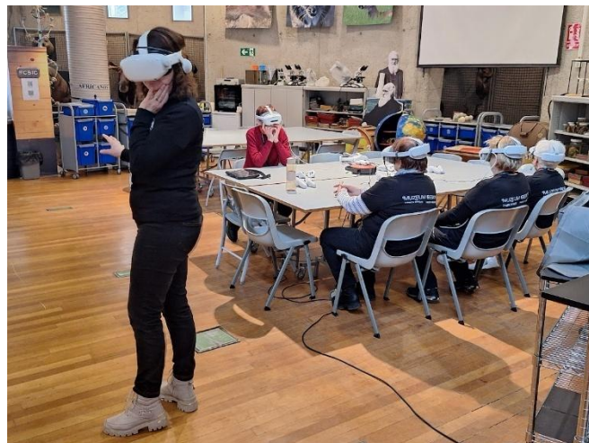
Účastníci mobility si poprvé vyzkoušeli VR brýle a zvyšovali tak své digitální kompetence.