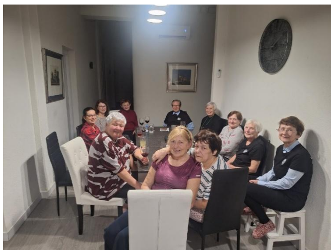
Mezi účastníky probíhaly pravidelné večerní reflexe jednotlivých aktivit.