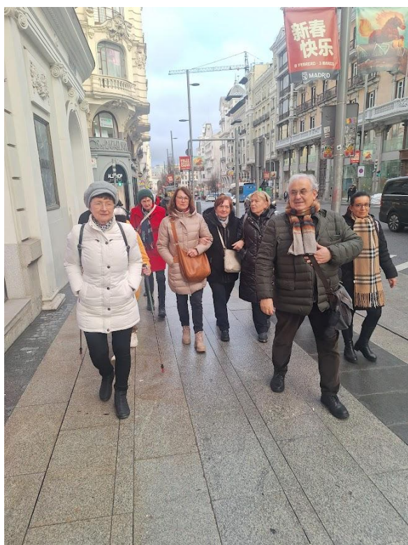
Večerní komentovaná prohlídka města.