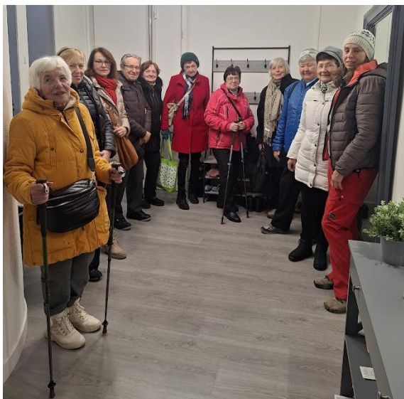
Účastníci mobility vyráží do muzea.