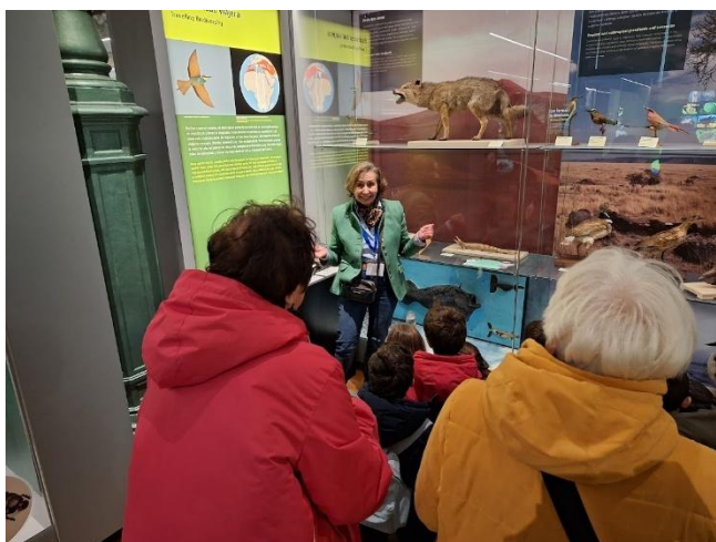
Observace muzejních edukačních programů pro děti vedených seniory z řad dobrovolníků organizace CEATE.