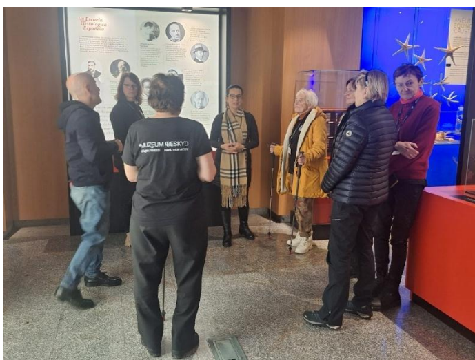
Prohlídka muzea, v rámci expozice proběhlo seznámení s nositelem Nobelovy ceny za fyziologii a medicínu Santiagem Ramónem y Cajalem.