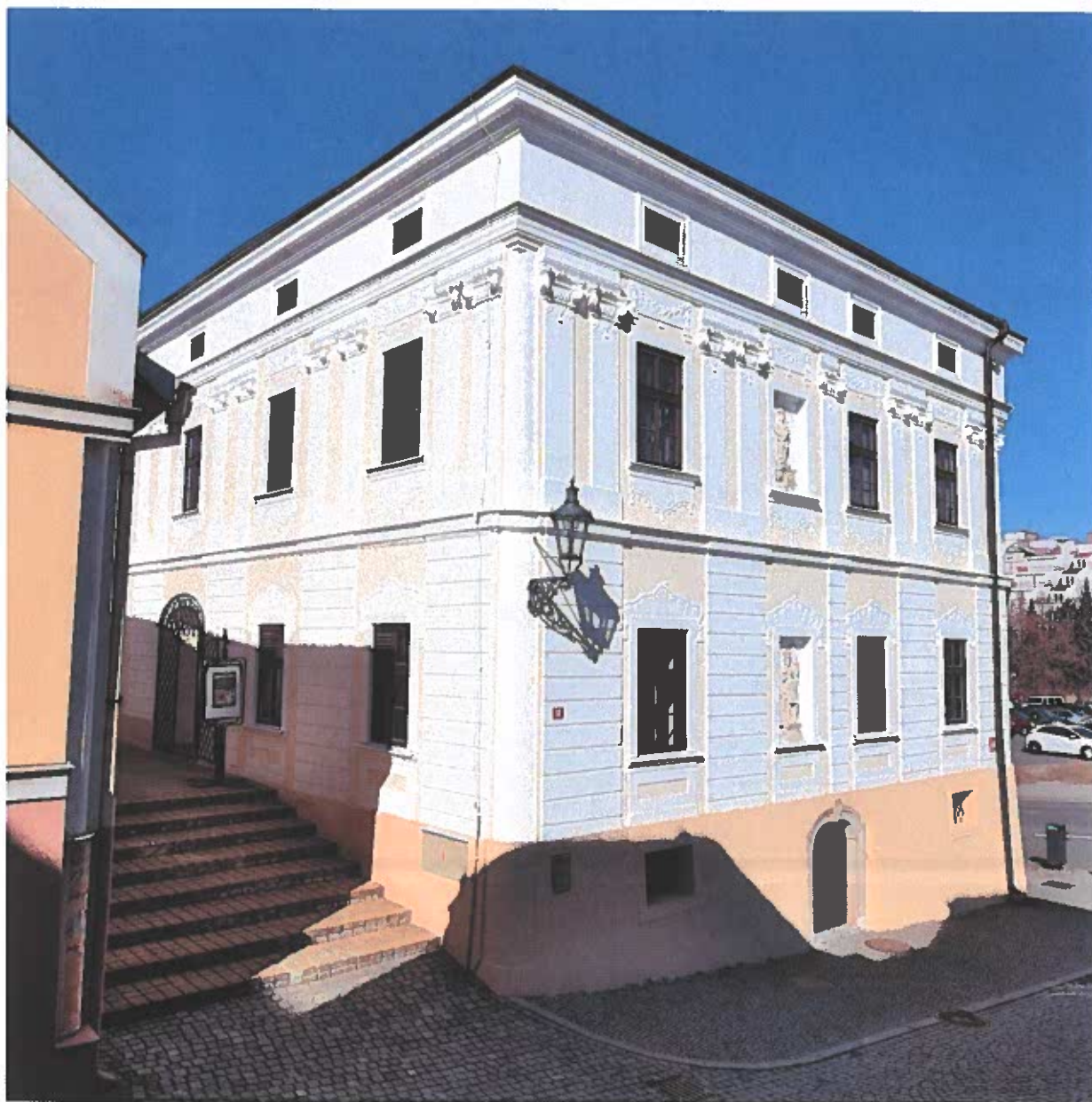
Oprava fasády Langova domu – stav po ukončení prací

Projekt byl zaměřen na digitalizaci objektu hradu Hukvaldy, archivaci zachycených dat a vytvoření mobilní aplikace s rozšířenou realitou.